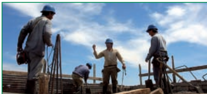
Obreros en una obra del Plan E en la región.

En total, según dijo, el Ministerio de Política Territorial aprobó 1.506 proyectos en la región, presentados por 381 ayuntamientos y una mancomunidad, con un presupuesto total de 192'89 millones de euros.