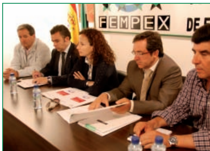
Imagen de la reunión de la Consejera con los Presidentes de las Mancomunidades para presentar el Plan ELE.

Con la distribución de estos 46 millones de euros, las ayudas del Plan ELE, más la convocatoria realizada para