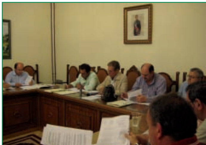
Pleno de la Mancomunidad Sierra de San Pedro celebrado en San Vicente de Alcántara.

En la misma línea, en el Pleno celebrado el día 18 de septiembre en San Vicente de Alcántara, el Presidente de la Mancomunidad anunció que se está avanzando junto a la Delegación del Gobierno en un Proyecto integral de mejora de los cruces de carretera en la Nac. 521, especialmente en 5 de ellos que cuentan con una mayor peligrosidad y que