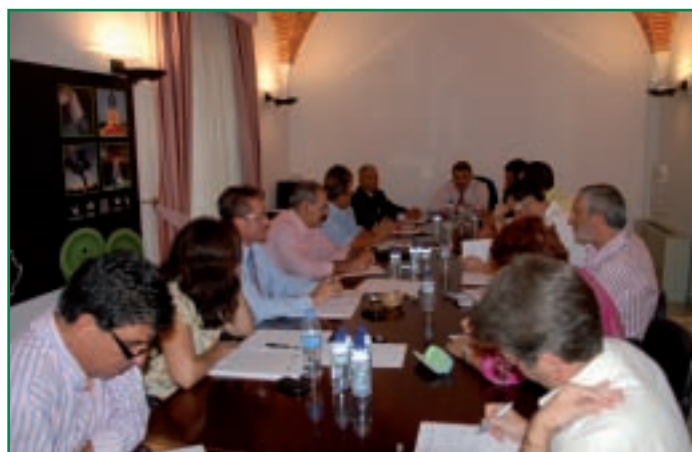
Vázquez durante un momento del encuentro con portavoces y representantes de Mancomunidades de la FEMPEX.

Finalizado el encuentro, la permanente de la sección de Mancomunidades mantuvo una reunión en la que se decidió que la Asamblea General de Mancomunidades Integrales se celebre el próximo 28 de octubre.