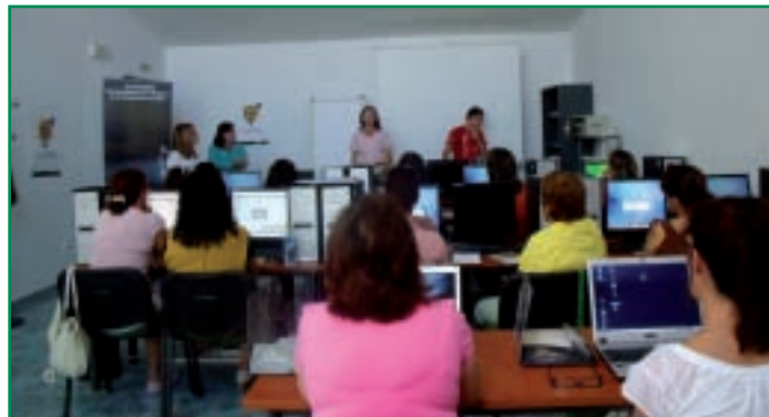
La Alcaldesa de Zahínos durante la Inauguración de la Jornada.

Con respecto a los talleres, se van a llevar a cabo actividades sobre alfabetización tecnológica para las mujeres de la Mancomunidad, dirigido a potenciar el uso de las TIC en el seno de las asociaciones de mujeres, para la mejora de su organización y gestión interna. Asimismo, se van a realizar también talleres de animación a la participación social y laboral, a través de los cuales se pretende incidir en la importancia de la participación de las mujeres en todos los ámbitos que componen la sociedad, en la necesidad de eliminar las