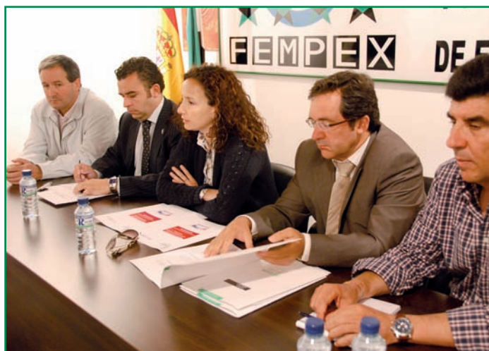
Imagen de la reunión de la Consejera con los Presidentes de las Mancomunidades para presentar el Plan ELE.

Con la distribución de estos 46 millones de euros, las ayudas del Plan ELE, más la convocatoria realizada para