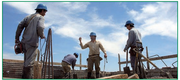
Obreros en una obra del Plan E en la región.

En total, según dijo, el Ministerio de Política Territorial aprobó 1.506 proyectos en la región, presentados por 381 ayuntamientos y una mancomunidad, con un presupuesto total de 192'89 millones de euros.