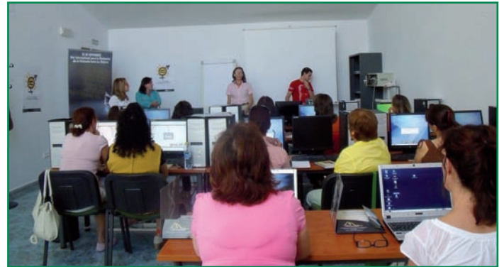
La Alcaldesa de Zahinos durante la inauguración de la Jornada.

Con respecto a los talleres, se van a llevar a cabo actividades sobre alfabetización tecnológica para las mujeres de la Mancomunidad, dirigido a potenciar el uso de las TIC en el seno de las asociaciones de mujeres, para la mejora de su organización y gestión interna. Asimismo, se van a realizar también talleres de animación a la participación social y laboral, a través de los cuales se pretende incidir en la importancia de la participación de las mujeres en todos los ámbitos que componen la sociedad, en la necesidad de eliminar las