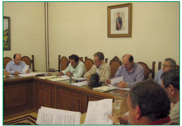
Pleno de la Mancomunidad Sierra de San Pedro celebrado en San Vicente de Alcántara.

En la misma línea, en el Pleno celebrado el día 18 de septiembre en San Vicente de Alcántara, el Presidente de la Mancomunidad anunció que se está avanzando junto a la Delegación del Gobierno en un Proyecto integral de mejora de los cruces de carretera en la Nac. 521, especialmente en 5 de ellos que cuentan con una mayor peligrosidad y que