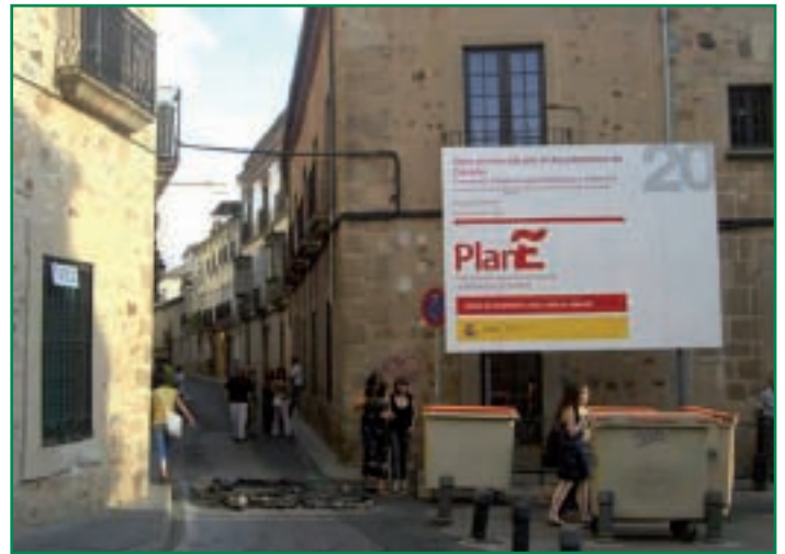
Actuaciones del Plan E en Cáceres.

A fecha de hoy, son ya 368 los municipios de la región ya han recibido fondos del Gobierno para la financiación