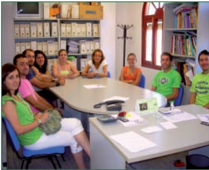
Nuevos trabajadores que se han incorporado a la Mancomunidad.

El personal con el que se cuenta está formado por 1 monitor de electricidad, 1 monitor de pintura, 1 director, 1 auxiliar administrativo, 1 coordinador de formación y 1 gestor de formación.