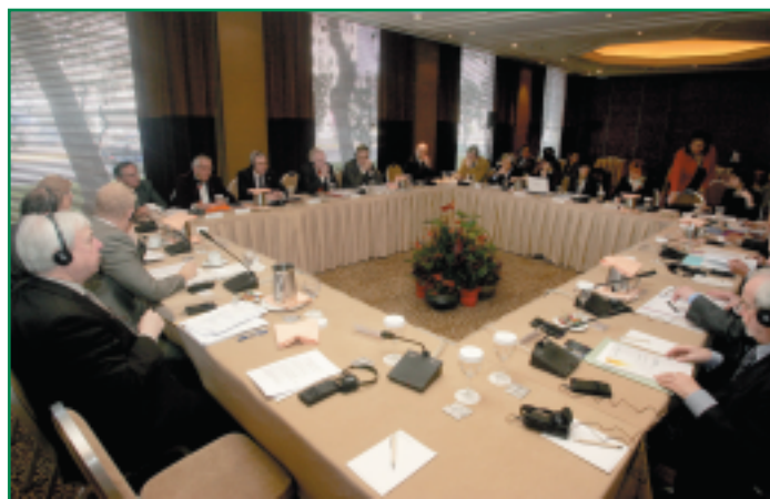
Miembros del Consejo de Municipios y Regiones de Europa