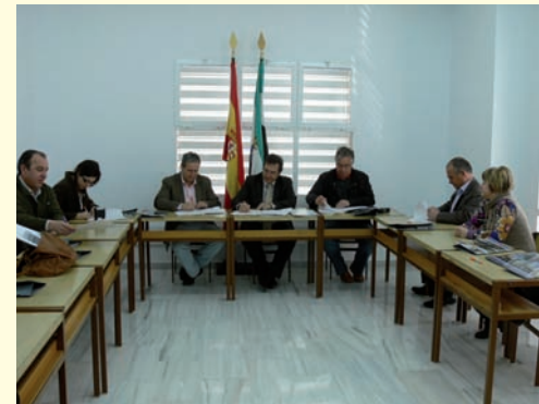
Mancomunidad Integral Sierra Suroeste.