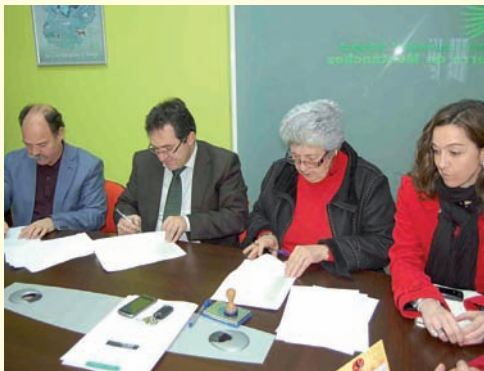
Mancomunidad Integral de Montánchez.