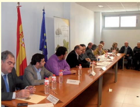
Mancomunidad de Servicios La Serena-Vegas Altas.