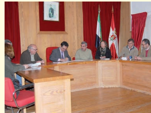
Mancomunidad Integral Villuercas-Ibores-Jara.