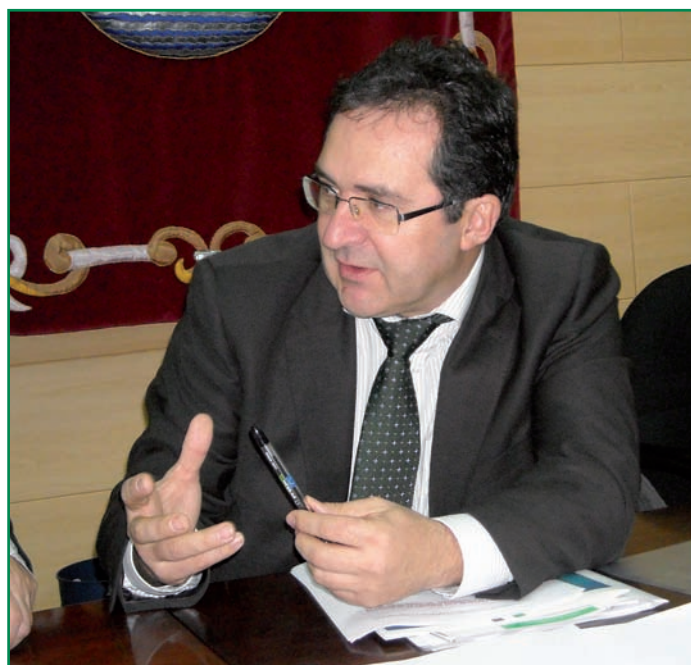
Pacheco en otro momento de la entrevista.

Tendrá como competencias: modificar los documentos planificados, programar y reprogramar