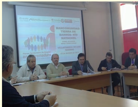
Mancomunidad Integral Tierra de Barros Río Matachel.