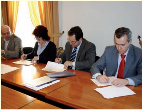
Mancomunidad de municipios La Serena.