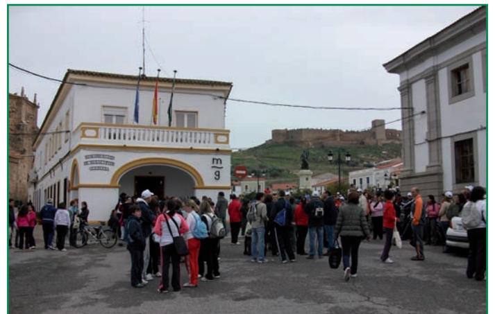
Participantes en la ruta de Medellín.

Finalmente, los arqueólogos explicaron todos los hallazgos conseguidos en el Parque Arqueológico de Medellín y la Asociación Teatral “Francisca Cortés”, hizo una pequeña representación en el Centro de Interpretación como colofón a una gran jornada donde actividad física y cultura estuvieron estrechamente unidas.