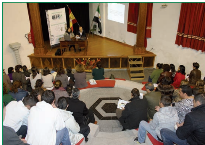
Autoridades y asistentes durante la jornada.

A través de ellas se pretende acercar a cada territorio aquellos programas y ayudas de apoyo a la creación y consolidación de las empresas que se están llevando a cabo por parte de la Administración. De este modo, en las ponencias se abordan distintos temas, como los programas para la puesta en marcha de empresas, las ayudas económicas destinadas a madurar la idea de negocio, la creación, ampliación y mejora de la competitividad de empresas, programas para la consolidación empresarial, formación, tutorización, innovación e internacionalización de empresas extremeñas.