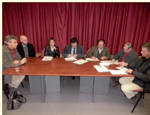
Mancomunidad Trasierra Tierras de Granadilla.