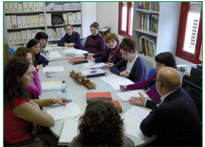
Reunión de trabajo en la Mancomunidad.

profesional y siempre actuando por el interés superior del menor.