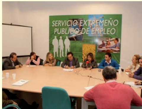
Mancomunidad Integral Tajo Salor.