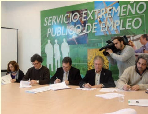
Mancomunidad Integral Sierra de San Pedro.