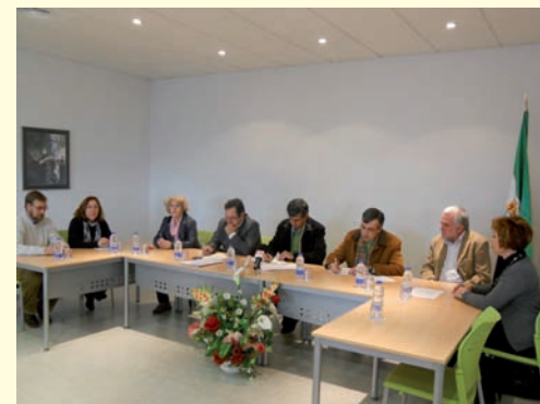
Mancomunidad Zona Centro.