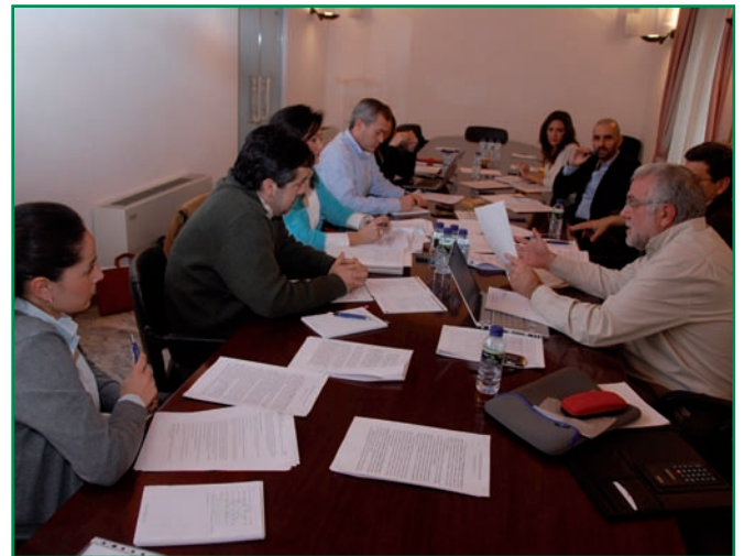
Reunión de técnicos coordinadores de los PTE.

Las organizaciones sindicales y empresariales, junto con REDEX, las Diputaciones Provinciales y la FEMPEX, con el aval del Servicio Extremeño Público de Empleo (SEXPE) hemos venido trabajado junto con mancomunidades, grupos de acción y otros agentes del territorio en una misma dirección. El objetivo: articular 28 documentos diferentes con acciones que respondan a las necesidades y demandas