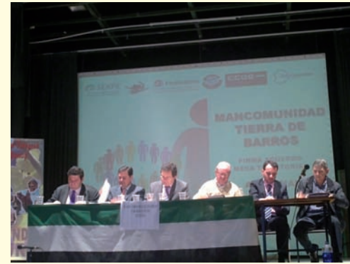
Mancomunidad Integral Tierra de Barros.