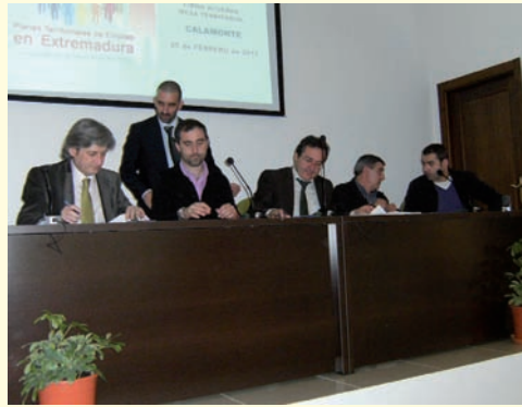
Mancomunidad Integral de Municipios Centro.