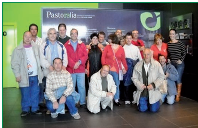
Participantes en la visita.

fomentar la inclusión social a grupos con problemas de adaptación al entorno económico y social.