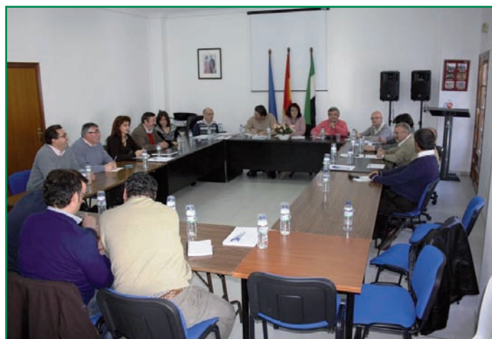
Imagen de la reunión en asamblea de la Mancomunidad.

través de un profesional de la Mancomunidad (del Programa de Familia, Acercando Culturas, trabajador social...) previo informe, o a través de los respectivos Ayuntamientos que se dirigirán al Agente de Inclusión Social de la Mancomunidad. Se trata de un proyecto piloto. Su implantación y desarrollo se realizará a partir de marzo de 2011 y continuará si se estima viable.