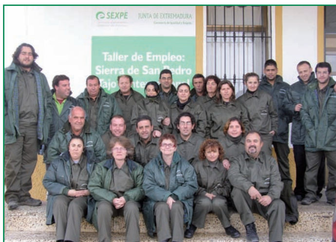
Participantes en el proyecto de formación y empleo puesto en marcha por la Mancomunidad.