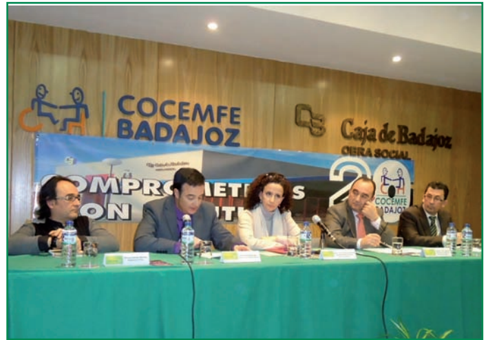
Momento de la presentación del proyecto.

Así, próximamente comenzará la captación de ideas y en septiembre se celebrará un evento denominado